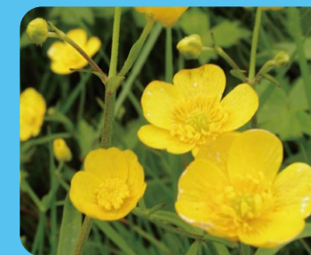
ミヤマキンボウゲ(深山金鳳花)