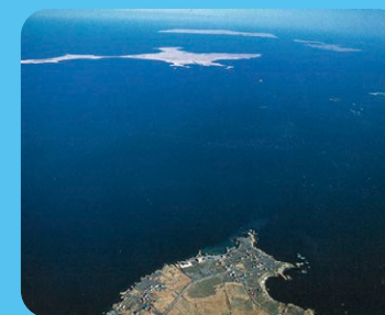
歯舞群島(納沙布岬からの様子)