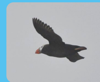
国後水道を飛翔するエトピリカ