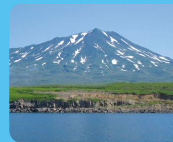
択捉島(散布山の風景)