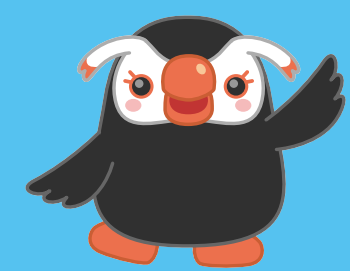
北方領土イメージキャラクター エリカちゃん

後援 内閣府北方対策本部/外務省/(独)北方領土問題対策協会/北海道/根室市/(公社)北方領土復帰期成同盟 (公社)千島歯舞諸島居住者連盟/大阪府/大阪市/堺市/大阪府市長会/大阪府町村長会