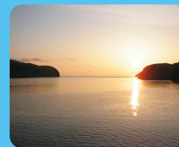
色丹島(穴濁湾の夕焼け)